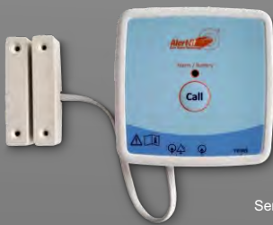
P163AA-D Sensor avisador para puerta

Los pulsadores ALERT-IT permiten al usuario enviar una señal de aviso al cuidador simplemente apretando el pulsador. En el caso del modelo anticaída, además de la función de aviso, el pulsador es capaz de detectar si el usuario se ha caído y de mandar en ese caso una señal de aviso al cuidador.