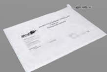
P149A Alfombra avisadora para silla