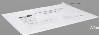
P143CB Alfombra pequeña para cama