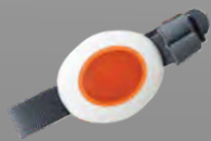
P135E Pulsador aviso

El detector de presencia ALERT-IT permite monitorizar a los pacientes de una habitación, detectando si alguno de ellos se ha movido. Puede colocarse en diferentes lugares de la habitación (pared, a ras de suelo, etc.), de tal manera que es posible configurar el dispositivo para que detecte diferentes tipos de movimientos.