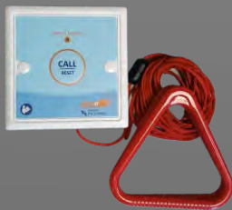
P209A Tirador aviso emergencia cuarto de baño

El sensor avisador para puerta permite detectar cuándo un paciente está intentando salir de su habitación. Una vez abierta la puerta, el sensor envía una señal al receptor del cuidador para que éste acuda.