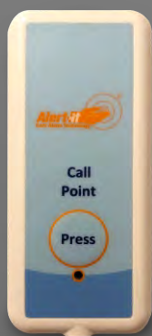
P176B Pulsador de llamada