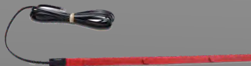
P143GAB Tira-sensor 80 cm para cama (bajo el colchón)