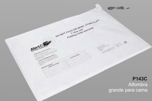
P143C Alfombra grande para cama

La medida de la tira sensor para silla es de 40 cm.