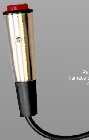
P156T Pulsador de llamada con cable en espiral